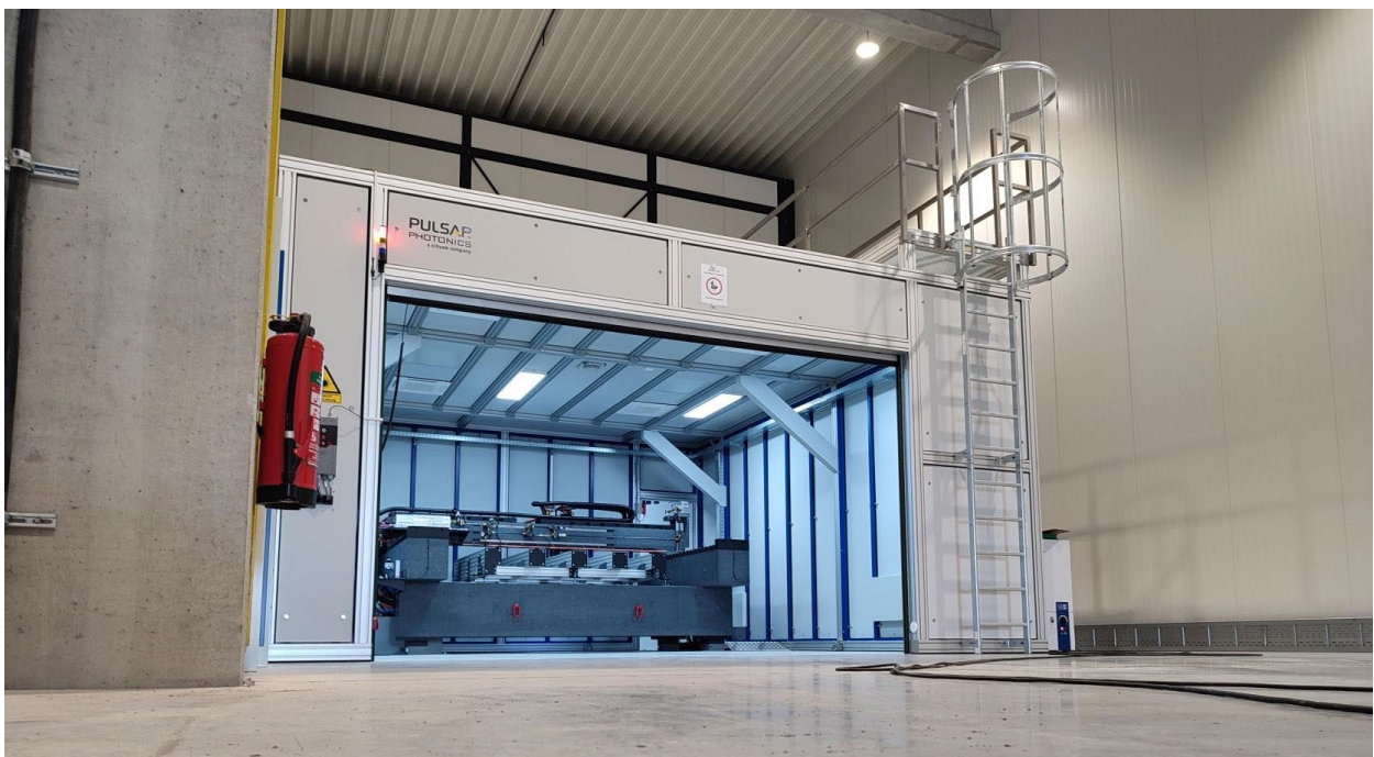
Abbildung 1: Brücken-Technologie: Das modulare Gantrysystem RDX2800 ermöglicht mit mehreren Arbeitsstationen die ultrapräzise Lasermikrobearbeitung von maximal 2,5 mal 1,5 Metern großen Flachbauteilen.

Im EU-Infrastrukturprojekt NextGenBat haben die Aachener bereits gezeigt, wie sich die Produktivität der Lasermikrobearbeitung erheblich steigern lässt. Sie entwickelten eine Rolle-zu-Rolle-Anlage, die Elektroden für Lithiumionen-Zellen trocknet und strukturiert. Die „MultiBeamMultiScanner“-Optik teilt dabei die Laserleistung in mehrere Teilstrahlen, um effizienter zu arbeiten. Den ersten Schritt zum Modulbaukasten macht das Unternehmen nun mit einem Pilotkunden. „Die industrielle Umsetzung im großen Maßstab ist der besondere Reiz“, erklärt Dr. Ryll. Geplant ist für den Pilotkunden eine Anlage, in der mehrere miteinander verkettete Arbeitsstationen die über zehn Quadratmeter große Oberfläche von flachen Bauteilen mit UKP-Laser und Multistrahls-technik mit mehreren Teilstrahlen präzise aufrauen und strukturieren.