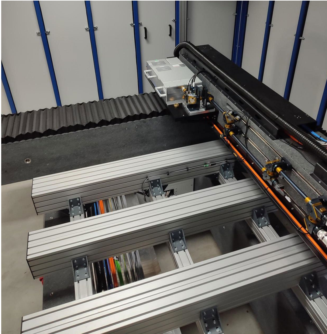
Abbildung 2: Take five: Das modulare Gantrysystem RDX2800 kann bis zu fünf Module aufnehmen, wobei jede Station für Multistrahlbearbeitung ausgelegt ist.